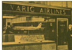
3 - Loja de N. York

Justificando mais uma vez o título de pioneira, a VARIG, em 1959, ingressa na era do jato com a chegada do primeiro Caravelle. Em agosto de 1960 começou a operar com o Boeing 707 na linha internacional, possibilitando vôos sem escalas entre Rio de Janeiro e New York, em nove horas e trinta minutos. Para uma idéia do vulto do investimento, basta considerar que um quadrimotor da classe Boeing 707 custava, na época, tanto quanto uma frota de 45 aviões Douglas DC-3.