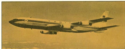
1 - Boeing 707