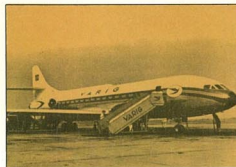
2 - Caravelle